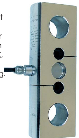
T20 5,10 & 20t

DFI instrumentet er meget velegnet til transportabel vejning og test formål, kan leveres med vejeceller fra 5kg træk som vist op til 100ton træk celler, har standard +/- PEAK, kan skifte mellem kg, t, N, kN. 16mm høje display med +/- visning. Kan også leveres med RS232 udgang samt software for data til Excel.